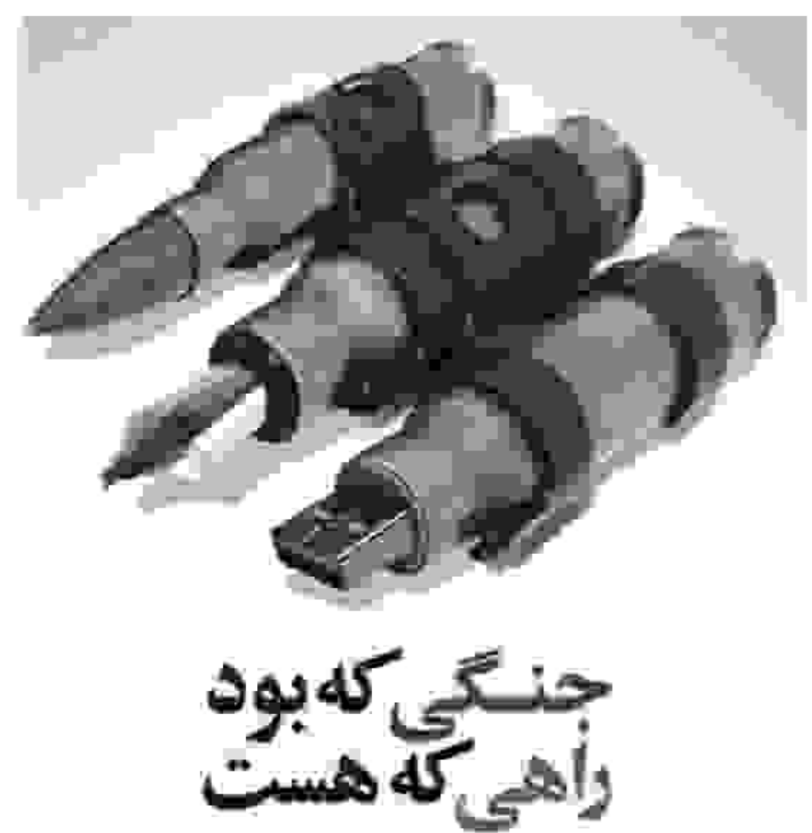
جنگی که بود راهی که هست

عزیزان من! رابطه خودتان را با خدا، هر چه می توانید مستحکم تر کنید؛ بخصوص در این ماههای مبارک - ماه رجب و ماه شعبان - که ماههای دعا، استغاثه، رابطه گرفتن با خدا، و راز و نیاز کردن با معشوق حقیقی هر انسان است. در این ماهها، خود را برای ورود بر سر سفره ضیافت الهی - در ماه رمضان - آماده کنید. بیانات در دیدار جمعی از بسیجیان ۱۳۷۶/۰۹/۰۵